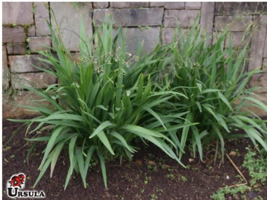
Dianela ( Dianella Tasmanica )