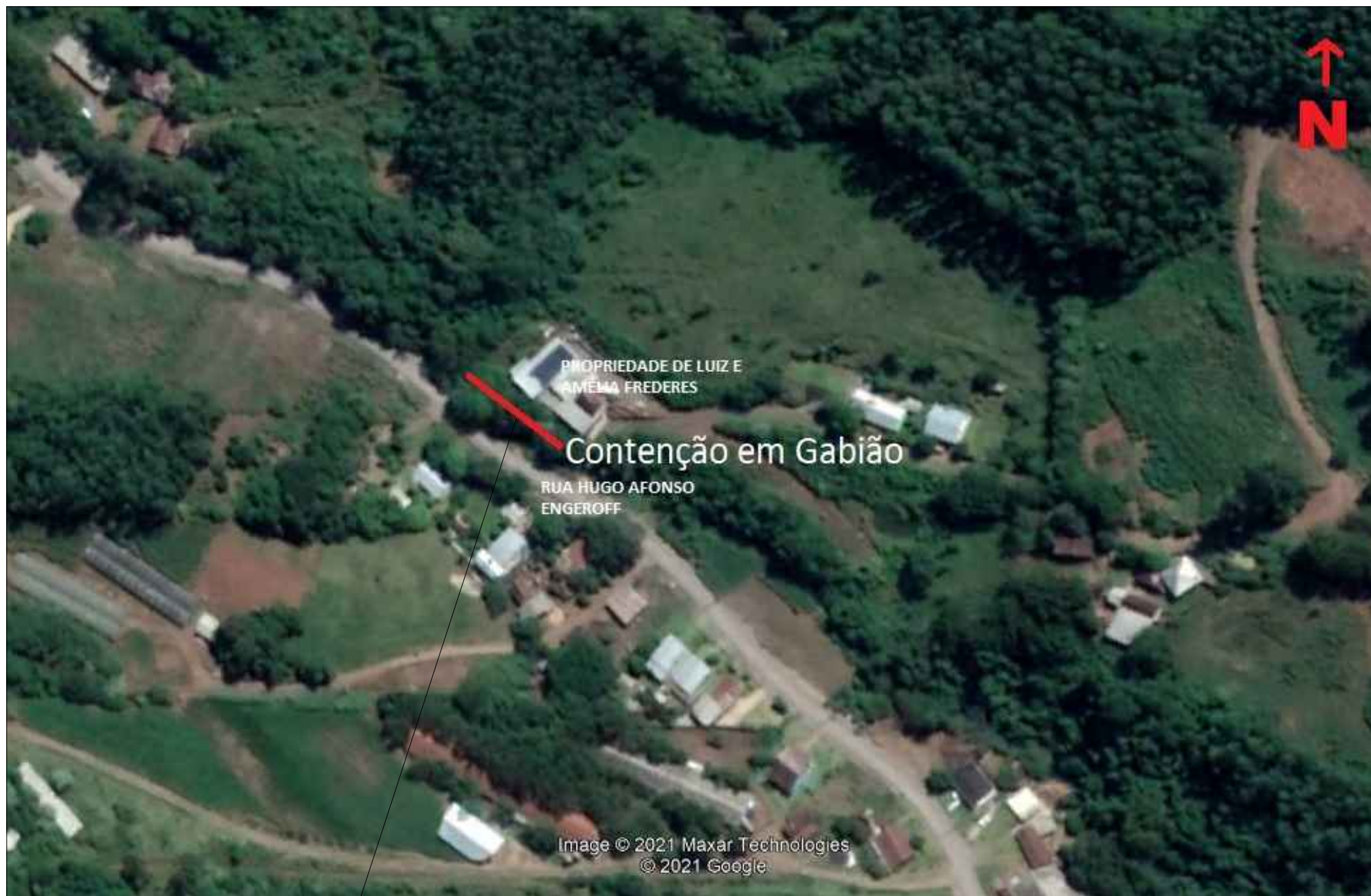
MURO DE CONTENÇÃO EM GABIÃO